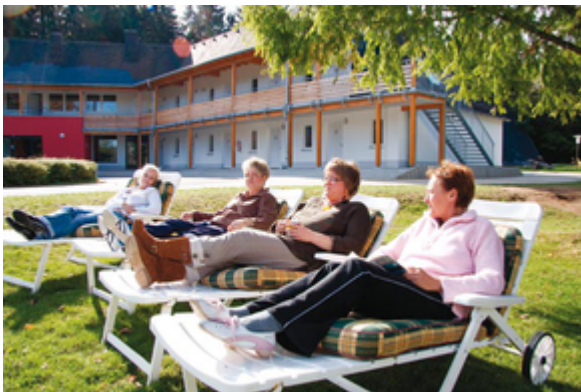
Zeit für Ruhe und Erholung