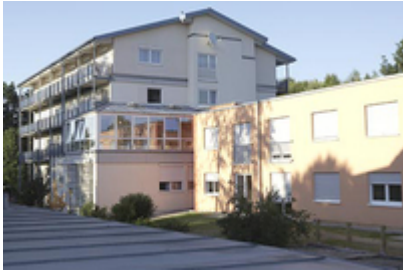
Rehaklinik Schwabenland → direkt zur Klinikhomepage