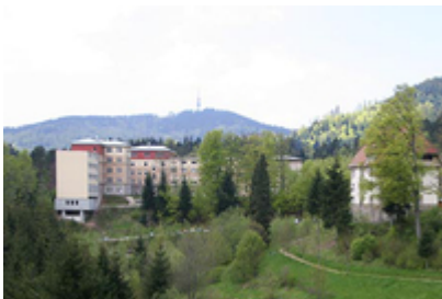
Rehaklinik Kandertal - Reha für Familien → direkt zur Klinikhomepage