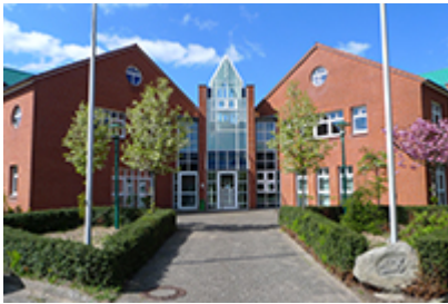
Rehaklinik Selenter See → direkt zur Klinikhomepage